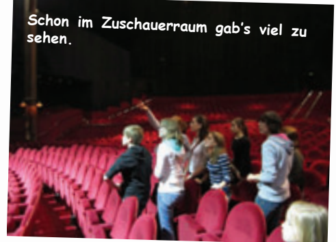
Schon im Zuschauerraum gab's viel zu sehen.