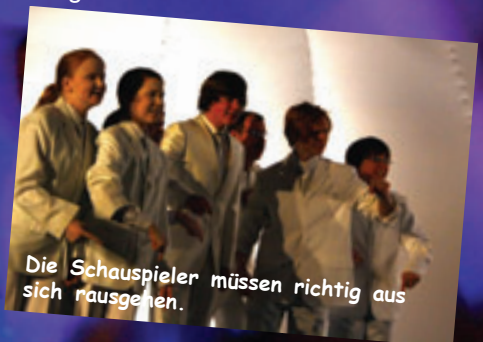
Die Schauspieler müssen richtig aus sich rausgehen.

Ich glaube, der Spaß in der Gruppe liegt auch in der Leistungsorientierung. Ich fordere ganz viel von den Kindern, aber sie merken auch, dass sie ganz viel davon haben. Sie liefern eine tolle Leistung ab und können nachher auch stolz auf ihre Arbeit sein. Das ist aber auch ganz viel Arbeit.