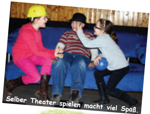
Selber Theater spielen macht viel Spaß.

Wir wünschen euch viel Spaß beim Nachspielen!!!