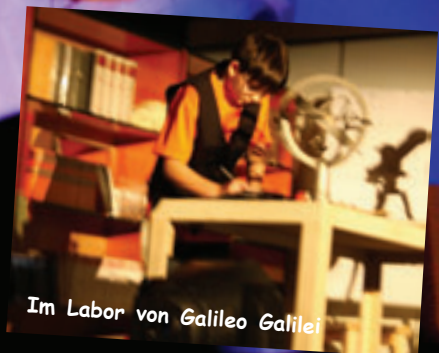
Im Labor von Galileo Galilei