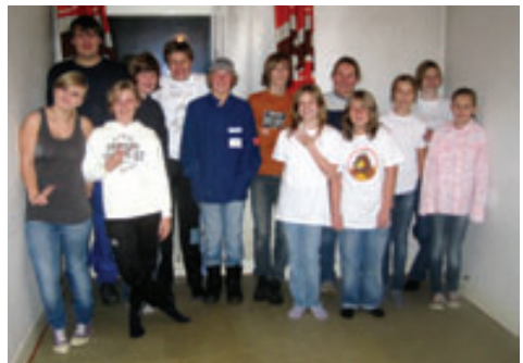
Hier waren wir noch ganz sauber.

Wir hatten eine Menge Spaß. Es ist auf jeden Fall weiterzuempfehlen, man sollte aber die passenden Räumlichkeiten und Klamotten nutzen.